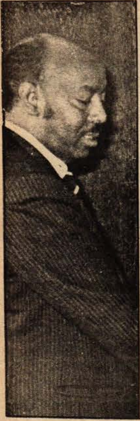
Somali Devlet Başkanı Siad Barre